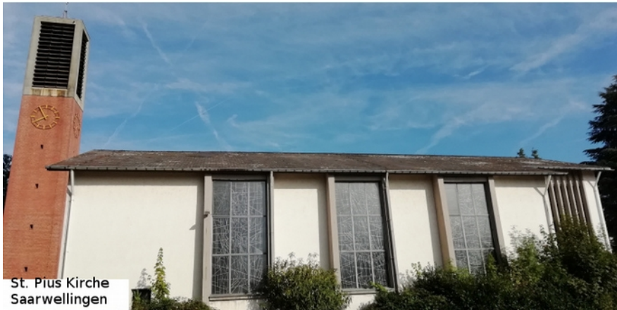
St. Pius Kirche Saarwellingen

Eröffnung der Veranstaltungsreihe ist am Freitag, den 27. September, 19.00 h. Alle Veranstaltungen finden in der St. Pius-Kirche in Saarwellingen statt. Unter Leitung des Saarwelliger Künstlers Mario Andruet wird die Kirche vorbereitet und gestaltet. Auszug aus den Veranstaltungen: